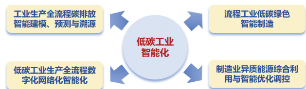
图 1 低碳工业智能化主要研究方向