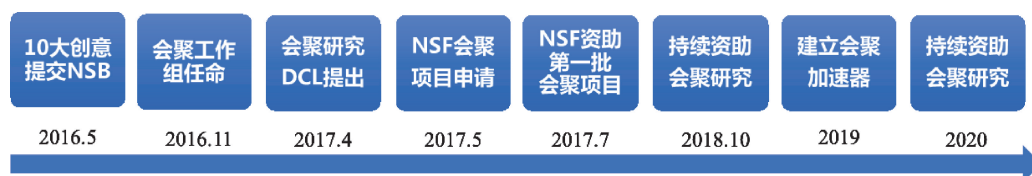
图1 融合研究资助的时间线 ②