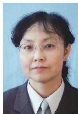
谭宗颖 中国科学院文献情报中心研究员,博士生导师。研究方向为科技发展战略与科技评估、情报研究方法与技术。